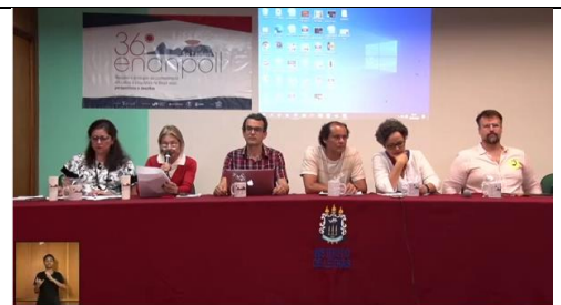
Mesa 3: Ciência, ética e interlocução com a sociedade